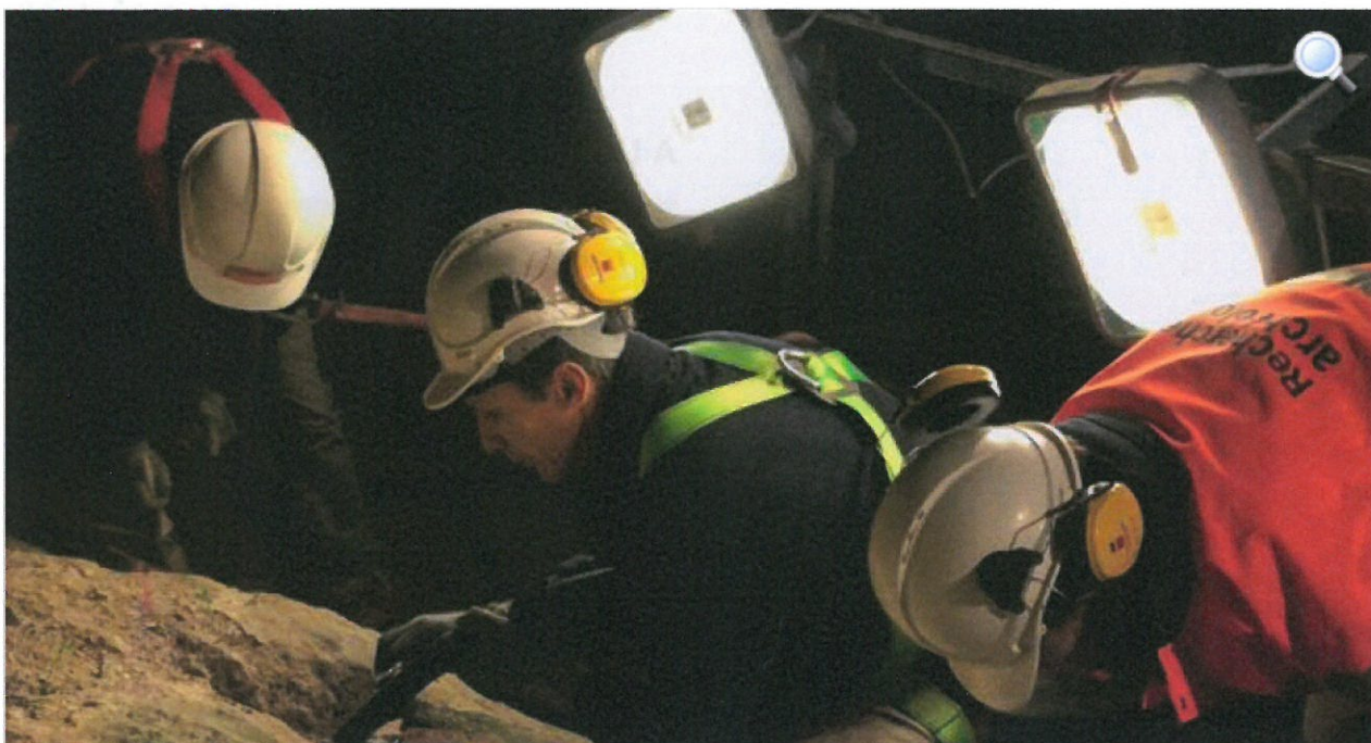
Les archéologues de l'équipe de fouille du Mas d'Azil.