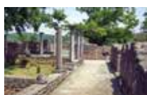
Villa gallo-romaine de Montmaurin