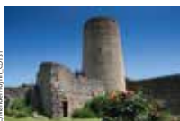
Village médiéval d'Aurignac