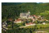
Cité antique et médiévale de Saint-Bertrand de Comminges